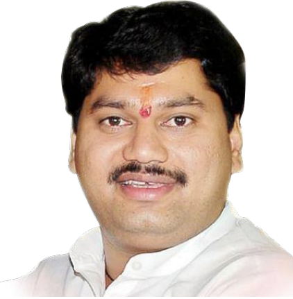
मा. ना. श्री. धनंजय मुंडे सामाजिक न्यायमंत्री, महाराष्ट्र राज्य