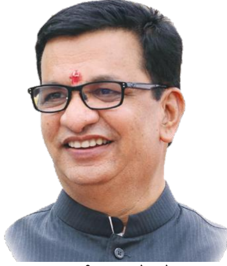
मा. ना. श्री. बाळासाहेब थोरात महसूलमंत्री, महाराष्ट्र राज्य