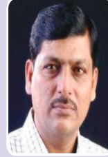
पापा मोदी (जिल्हाध्यक्ष काँग्रेस)