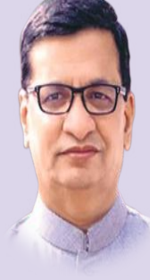
मा.ना.बाळासाहेब थोरात महसुल मंत्री, महाराष्ट्र राज्य