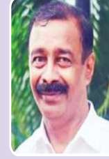
मा.माळी साहेब सहा.आयुक्त, महाराष्ट्र राज्य परीक्षा परिषद, पुणे