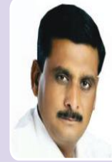
मा.आ.बाळासाहेब आजबे (विधानसभा सदस्य)