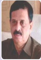
मा.दादासाहेब गायकवाड पोलीस मित्र, महाराष्ट्र राज्य करमाळा, जि.सोलापूर