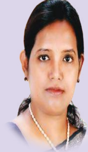
मा.ना.वर्षाताई गायकवाड शालेय शिक्षण मंत्री, महाराष्ट्र राज्य