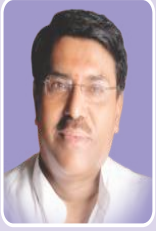
मा.जयदत्तजी क्षीरसागर (माजी मंत्री)