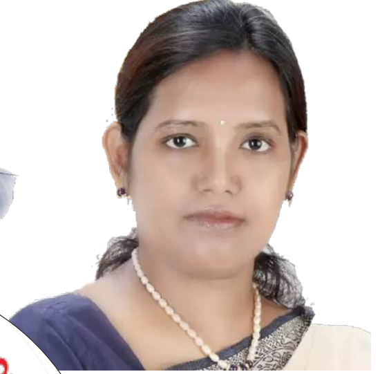
मा. ना. वर्षाताई गायकवाड शिक्षणमंत्री, महाराष्ट्र राज्य