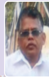
मा.एम.ए.गुंड शिक्षण विस्तार अधिकारी टंकलेखन विभाग, बीड