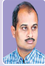
मा.आ.लक्ष्मणअण्णा पवार (विधानसभा सदस्य)