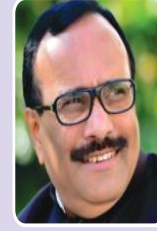
मा.आ.अतुल सावे (विधानसभा सदस्य)