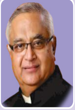
मा.आ.प्रकाशदादा सोळंके (विधानसभा सदस्य)