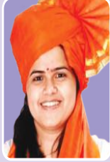
मा.आ.नमिताताई मुंदडा (विधानसभा सदस्य)