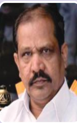
मा.अनिल गुंजाळ उपायुक्त म.रा.परीक्षा परिषद, पुणे