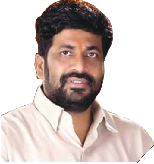
मा. ना. ओमप्रकाश उर्फ बच्चू कडू शिक्षण राज्यमंत्री, महाराष्ट्र राज्य