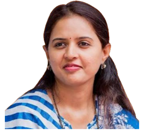
मा. खा. श्री. प्रीतम मुंडे खासदार, बीड लोकसभा

महाराष्ट्र राज्य टंकलेखन-लघुलेखन शासनमान्य संस्थांची संघटना, मुंबई