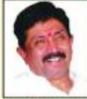
मा.आ.श्रीमंत रामराजे नाईक निंबाळकर माजी सभापती विधान परिषद