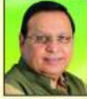
मा.श्री. राजेंद्रजी दडा माजी शिक्षणमंत्री तथा चिफ एडिटर लोकमत