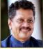
ना.श्री. दिपकजी केसरकर मंत्री, शालेय शिक्षण, महाराष्ट्र राज्य