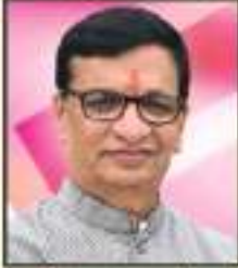
मा.आ.श्री. बाळासाहेब थोरात माजी मंत्री, शालेय शिक्षण, महसुल महाराष्ट्र राज्य