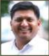
मा.आ.श्री. प्राजवलदादा तनपुरे माजी राज्यमंत्री, महाराष्ट्र राज्य