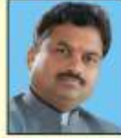
मा.आ.श्री. राम शिंदे माजी मंत्री