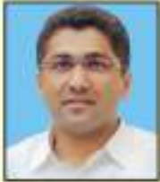
मा.आ.श्री. संग्रामभैरव्या जंगताप