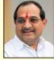
ना.श्री. राधाकृष्ण विखे पा. मंत्री, महसुल, महाराष्ट्र राज्य तथा पालकमंत्री, अहमदनगर जिल्हा